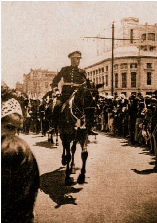
Foto 5. Desfile del 15 de septiembre en la ciudad de México, en el cual los alumnos de Chapingo participaban cada año.

(RSP) Pero hacíamos prácticas de tiro, no se que etcétera, nos leían y nos enseñaban y teníamos que aprender el reglamento, los códigos, no se que, todas estas historias. ¡Eh!, otro indicio de cosas, íbamos al desfile del 15 de septiembre éramos uno de los cuerpos que iban, el colegio militar, iban los de Chapingo, iban los de no se que, los de la escuela naval, etcétera, íbamos a las vallas que se le hacían al presidente el 1o de septiembre, se hacían unas vallas de militares, que iban desde el Palacio Nacional, hasta la Cámara de Diputados y el pasaba por ahí por esas calles, iba a rendir su informe.