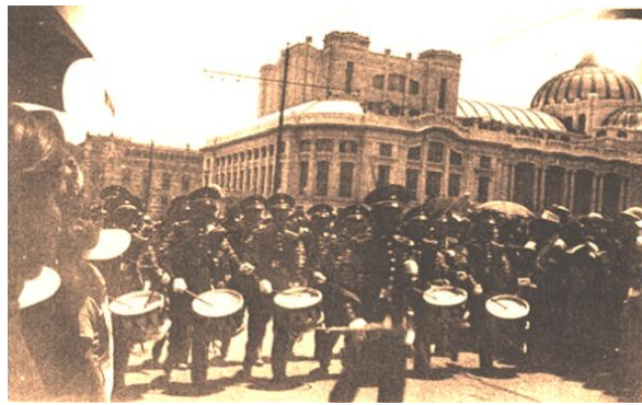
Foto 6. Participación de alumnos de la Escuela Nacional de Agricultura en el desfile militar en la ciudad de México, D.F.

los hace no se “más algo” puede que hasta les de un, para mi, un falso sentido de superioridad ,o lo que sea. Si a mí me gusta donde estoy, pues ser en todo aquello que considero que es bueno, pero ¡cuidado!, porque no todas las cosas las adopto donde quiera que esté, pero todas aquellas cosas que son o buenas o diferentes, hacerlas de acuerdo con el modo de ser de las gentes de ahí y en la medida de lo posible pues tal vez sería una actitud de mimetismo, pasar desapercibido o sea no ser claramente alguien, que no pertenece, que no perteneció a ese lugar, entonces eso fue muy rápido, muy fácil.