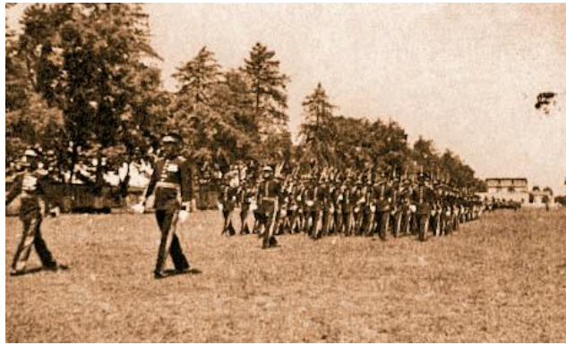
Foto 4. Había que hacer la instrucción militar todos los días.

expresar por lo menos en palabras que se entienden pero que ya han sufrido un análisis y una evolución a través de mi evolución personal también, que se me ha presentado en forma tal vez distinta de lo que yo percibía en aquel entonces, pero ahí comenzó, digamos, mi conocimiento, y mis inquietudes respecto a México ¿mmh?, por ese lado.