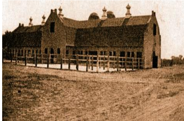
Foto 2. Los establos, Chapingo 1941

candidatura, creo que sí pasamos ampliamente y ahora verá usted por qué, en algo que sigue, el caso es que fuimos admitidos ahí.