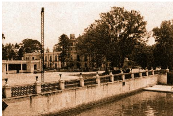
Foto 3. En primer plano: alberca y al fondo el edificio principal de la entonces Escuela Nacional de Agricultura, 1941.

Esta experiencia del examen especial, hizo que nos conocieran algunos profesores, que no iban a ser profesores nuestros hasta, bastantes años después, o hasta algunos años después, pero que les llamamos la atención porque veníamos bien preparados, y eso valió mucho como verá usted después, la otra cosa es que, el hecho de que ya tomáramos clases con los de segundo año, hizo que la intensidad de las novatadas y todo eso disminuyera porque los de segundo año, con quienes tomábamos clases, pues ya tendían a considerarnos como de la misma generación que ellos, que éramos desde el punto de vista académico y no nos molestaban, de modo que eso hizo también más tolerable la esa parte desagradable del primer año.