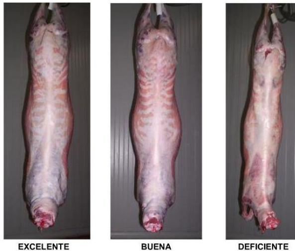
Figura 2. Conformación de las canales de ovinos

Conjuntando los cuatro factores de evaluación, finalmente se clasifican en cuatro categorías: México extra; México 1 (selecta); México 2 (comercial); Fuera de clasificación (Martínez, 2008).