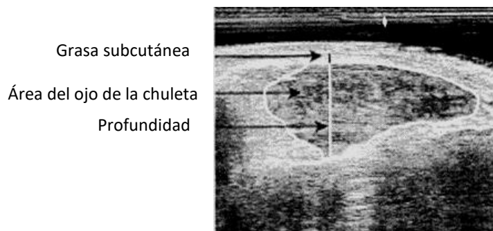
Figura 3. Vista transversal del músculo en la doceava costilla con ultrasonido.

Las principales mediciones que se realizan en ovinos con ultrasonido en tiempo real son: profundidad, anchura y área del músculo del lomo (ojo de chuleta); también se mide el espesor de la grasa subcutánea o de cobertura, y se puede realizar la evaluación del espesor de la grasa que cubre el pecho. Por lo general, las mediciones del lomo se asocian con la composición de la canal, mientras que las de la grasa indican el grado de finalización del animal (Partida, 2008b).