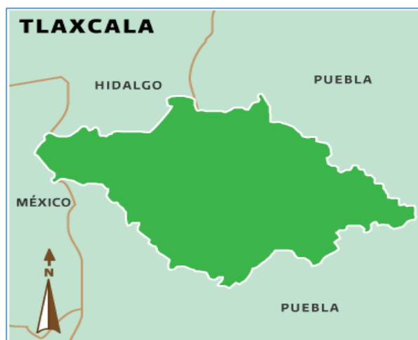
Figura 1. Localización del estado de Tlaxcala.

La presente investigación se realizó en el estado de Tlaxcala. Esta entidad federativa ésta situada en el centro-oriente de la República Mexicana y limita al norte con estado de Hidalgo y Puebla; al este y sur con Puebla; al oeste con Puebla, México e Hidalgo (Figura 1).